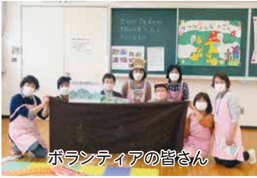
ボランティアの皆さん

スタッフの皆さんとの遊びなども、大変楽しいようで「おもちゃライブラリー」のある日を楽しみにしています。ありがとうございます。