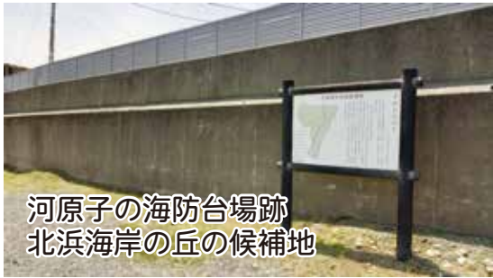
河原子の海防台場跡 北浜海岸の丘の候補地

現在は北浜海岸の丘が候補地として、解説の看板が立てられています。水戸藩で製造された大砲の射程距離は、一貫目玉筒では、鉄丸薬で1000mから1200m、百匁玉筒では鉄丸薬で450mから760mほどでした。これに対し、外国船の大砲の射程距離は、2000mから4000mの性能でした。参考資料『潮薫るまち河原子いまむかし』他