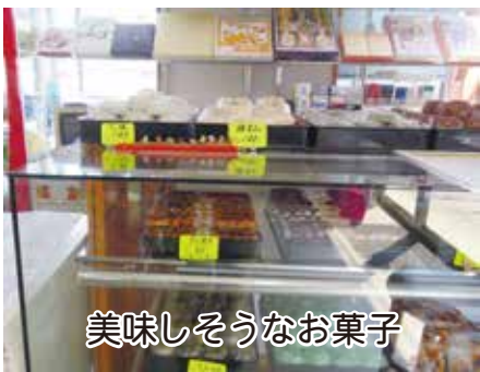
美味しそうなお菓子