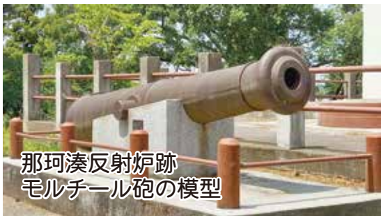
那珂湊反射炉跡 モルチール砲の模型