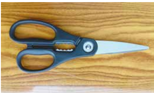
万能キッチンバサミ