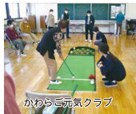
かわらご元気クラブ