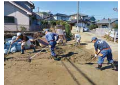
災害現場で活動する 河原子消防団

市内全域の被害は、河川が溢水し、床上・床下の浸水被害が発生するとともに、冠水や土砂崩れによる道路の通行止めが生じました。